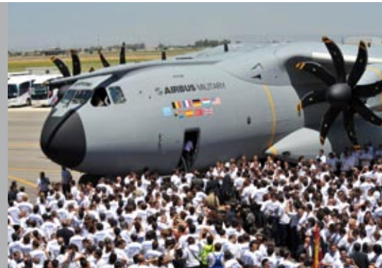
Roll Out des ersten Airbus A400M in Sevilla

Der Unternehmensbereich Raumtransport + Aerospace Strukturen dominiert die Konzernentwicklung mit einer nochmals gestiegenen unkonsolidierten Gesamtleistung von EUR 64,1 Mio. in den ersten sechs Monaten 2008 (Vorjahr: EUR 56,3 Mio.). Ein EBITDA von EUR 6,9 Mio. (Vorjahr: EUR 5,8 Mio.) und ein EBIT in Höhe von EUR 5,0 Mio. (Vorjahr: EUR 4,0 Mio.) dokumentieren den Aufwärtstrend im Vergleich zu Q1/2008.