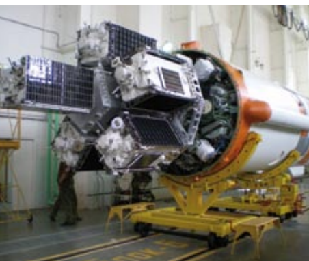
Cosmos-Rakete mit sechs integrierten ORBCOMM-Satelliten

OHB-Konzern erstmals mit drei Unternehmensbereichen auf der ILA vertreten