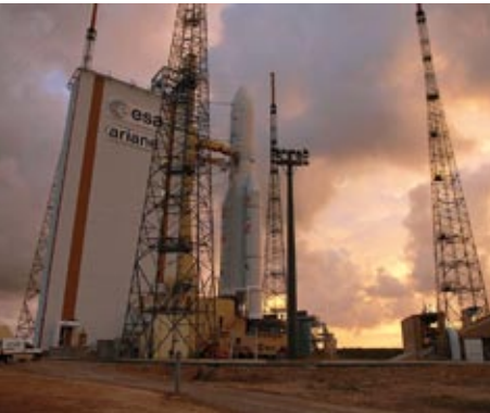
Ariane-5-Rakete auf dem Startplatz in Kourou, Französisch-Guyana